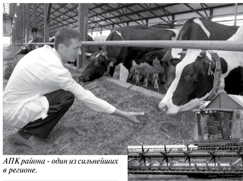
АПК района - один из сильнейших в регионе.