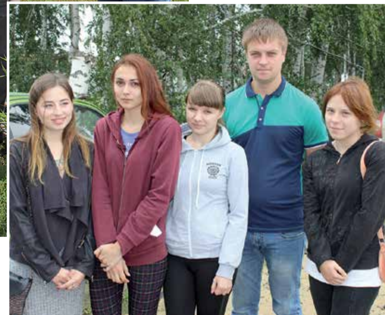
Многие из студентов РГАТУ после практики хотят остаться работать в хозяйствах Сараевского района.