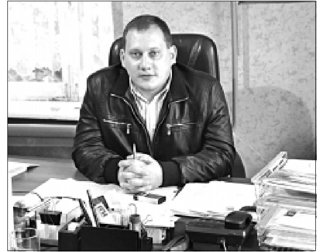
— Здоровья, счастья, успехов, материального и семейного благополучия!

— Что вы пожелаете в новом году своему коллективу, жителям Моловки и жителям района?