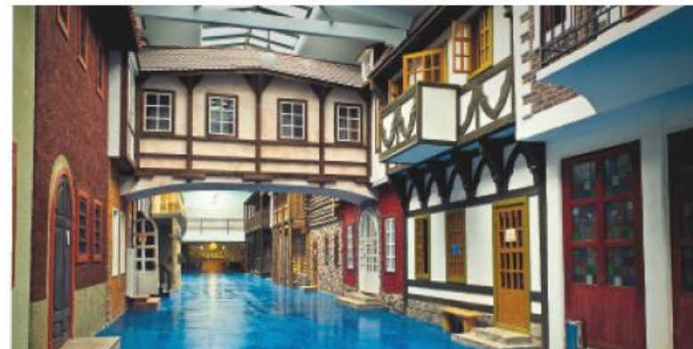
«ВОКРУГ СВЕТА» Европа, Северная Америка