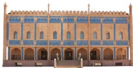
ЮЖНАЯ АЗИЯ. Конгресс-холл