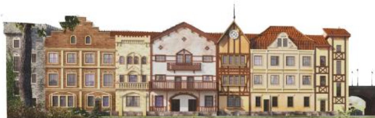
ЗАПАДНАЯ И СЕВЕРНАЯ ЕВРОПА