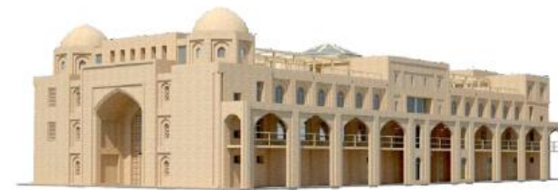
ЦЕНТРАЛЬНАЯ АЗИЯ. Караван-сарай