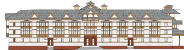
ЮЖНАЯ АЗИЯ. Гималайский дом