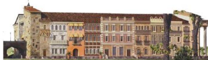
ЮЖНАЯ И ВОСТОЧНАЯ ЕВРОПА