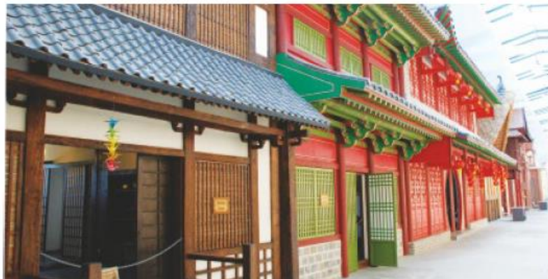
«ВОКРУГ СВЕТА» Азия, Африка, Латинская Америка, Австралия, Океания