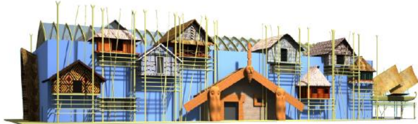
АВСТРАЛИЯ И ОКЕАНИЯ